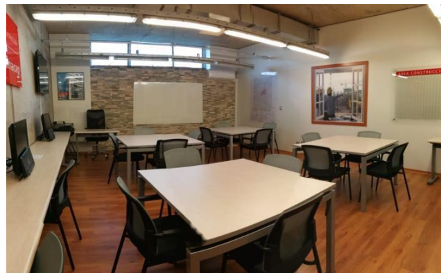
Figura N° 5. Vista amplia del TEP. Elaboración propia.