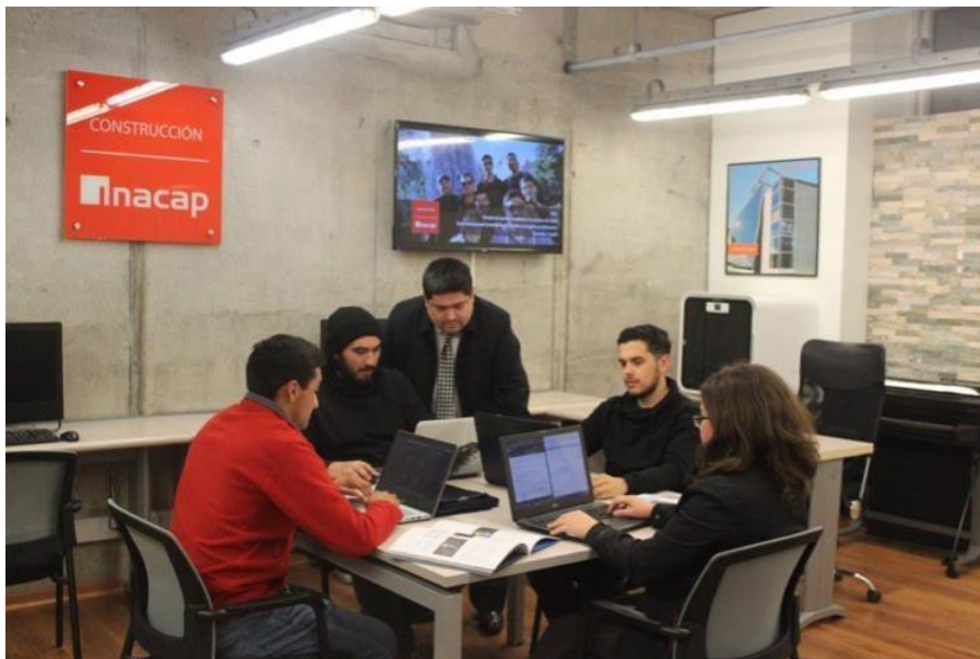
Figura N° 4. Estudiantes de Seminario de Título en TEP. Elaboración propia.

Resulta importante indicar que los estudiantes pueden asistir a una clase planificada por el académico en el TEP, como hacer uso de éste de forma autónoma e independiente, de acuerdo a lo que sus asignaturas requieran.