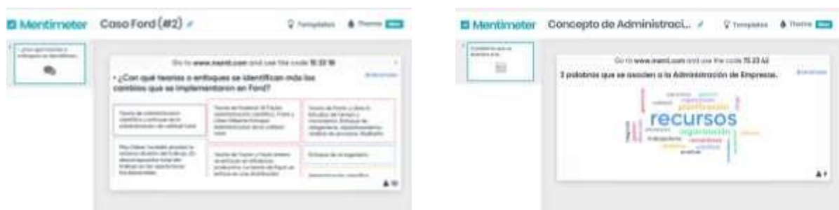
Figura 4. Ejemplo de actividades utilizando Mentimeter ( www.mentimeter.com )

En la figura 4 se muestran dos actividades. La primera de ellas expone los resultados que los estudiantes expusieron a través de sus teléfonos celulares y la figura contigua una situación similar, pero expresando aquel concepto que se repitió un mayor número de veces.