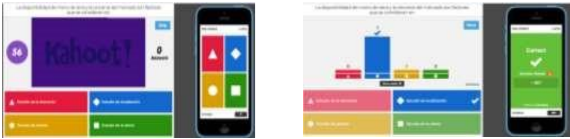
Figura 5. Ejemplo de evaluación utilizando Kahoot ( https://create.kahoot.it/ )

Actualmente (segundo semestre 2018) los autores continúan trabajando en el curso de Evaluación de Proyectos Generales, el cual es dictado en las carreras de Ingeniería Civil Industrial, Ingeniería Comercial e Ingeniería en Aviación Comercial del Campus Vitacura de la Universidad Técnica Federico Santa María, de tal forma de evidenciar de manera estadísticamente significativa el nivel de impacto del uso de estas metodologías para los estudiantes. Esto se evidenciará con la aplicación de una encuesta pre y post curso, así como con los resultados en las evaluaciones parciales y finales de los estudiantes.