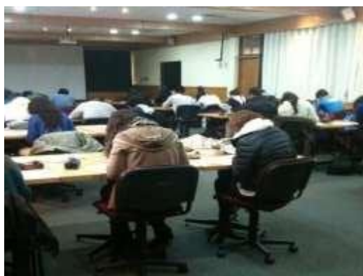
Figura 1. Evaluación individual tradicional

La aplicación de las técnicas indicadas muestra el involucramiento de los estudiantes en la sala de clases, como se aprecia en figura 2. Es factible comparar la aplicación de una evaluación parcial tradicional, donde no existe interacción (Figura 1) o trabajo colaborativo.