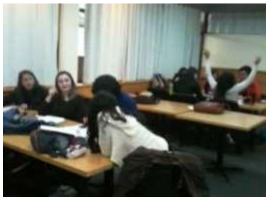
Figura 2. Evaluación con metodología activa (IF-AT)