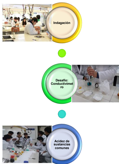
Figura N° 10. Trabajo en el laboratorio

En el trabajo práctico lo referente a la indagación y preparación de las actividades de laboratorio, fue un desafío muy bien logrado por los estudiantes, ya que ellos se sentían los constructores de sus experiencias, además se logró plena integración entre los miembros de los grupos que componían cada sección de laboratorio, arrastrando los más interesados a los menos entusiastas, se logró una buena cohesión de grupo.