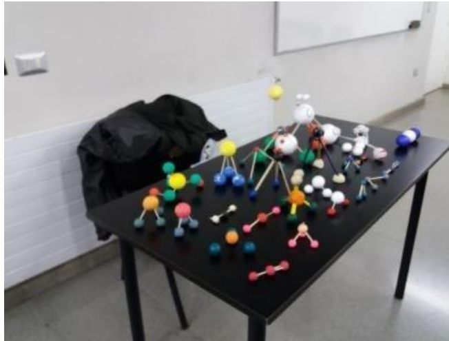
Figura N° 9. Tickets de entrada: modelos moleculares

En el trabajo práctico lo referente a la indagación y preparación de las actividades de laboratorio, fue un desafío muy bien logrado por los estudiantes, ya que ellos se sentían los constructores de sus experiencias, además se logró plena integración entre los miembros de los grupos que componían cada sección de laboratorio, arrastrando los más interesados a los menos entusiastas, se logró una buena cohesión de grupo.