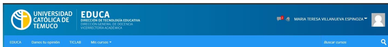
Figura N° 3. Plataforma Educa UCT.

Otra de las estrategias utilizadas fue el “Ticket de entrada”, en algunos contextos se les pedía a los alumnos una “tarea”, una investigación corta o un pequeño trabajo y que además mantuviera al joven interesado en la actividad, esta debía servirle como medio de entrada a la clase, estas peticiones eran publicadas -como todo el curso- en la Plataforma Moodle llamada: EDUCA de la universidad, quien no lo llevara estaba impedido de asistir.