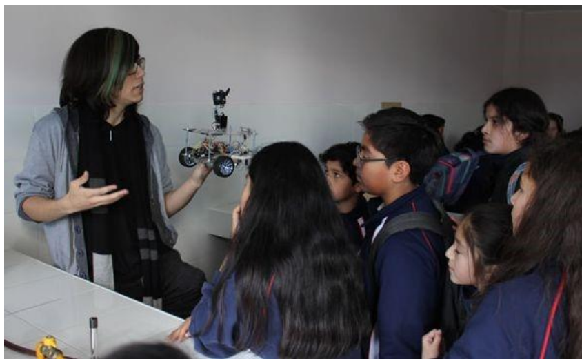
Figura N° 5. Taller de robótica para escolares de la ciudad de La Unión en la región de los Ríos.