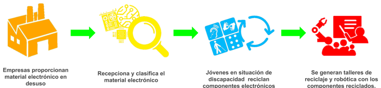
Figura N° 1. Esquema de proyecto EcoBots ( www.ecobots.cl ).

La Fig. 1 evidencia el proceso seguido por EcoBots, desde cómo se espera obtener elementos electrónicos en desuso desde empresas asociadas, para luego remover elementos peligrosos en una etapa de pre-clasificación gestionada por la universidad, hasta la participación de jóvenes en situación de discapacidad para reciclar y ser parte de talleres de robótica.