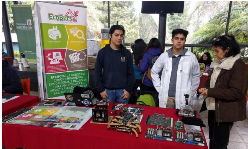
Figura N° 4. Imagen de los estudiantes que nos acompañan en las actividades de difusión.