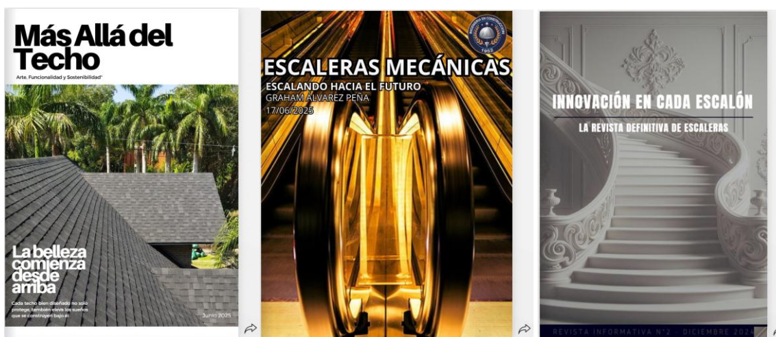
Figura 2: Portadas de revistas de los estudiantes

Para facilitar el desarrollo del proyecto, se proporcionaron tutoriales básicos sobre el uso de las herramientas seleccionadas y acceso a plantillas gratuitas. Adicionalmente, el docente ofreció asesorías semanales a los grupos para resolver dudas.