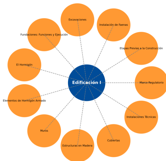
Figura 1: Mapa simplificado de unidades de la asignatura