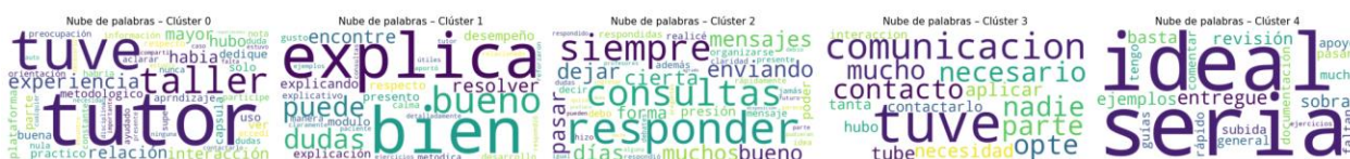
Figura 4. Distribución de términos representativos en los clústeres de respuestas abiertas a la consulta: comparte más detalles sobre tu experiencia con el tutor del taller.

La visualización mediante nubes de palabras sintetiza las experiencias compartidas por los estudiantes en torno a la tutoría, mostrando distintos énfasis según el clúster identificado (Figura 4).