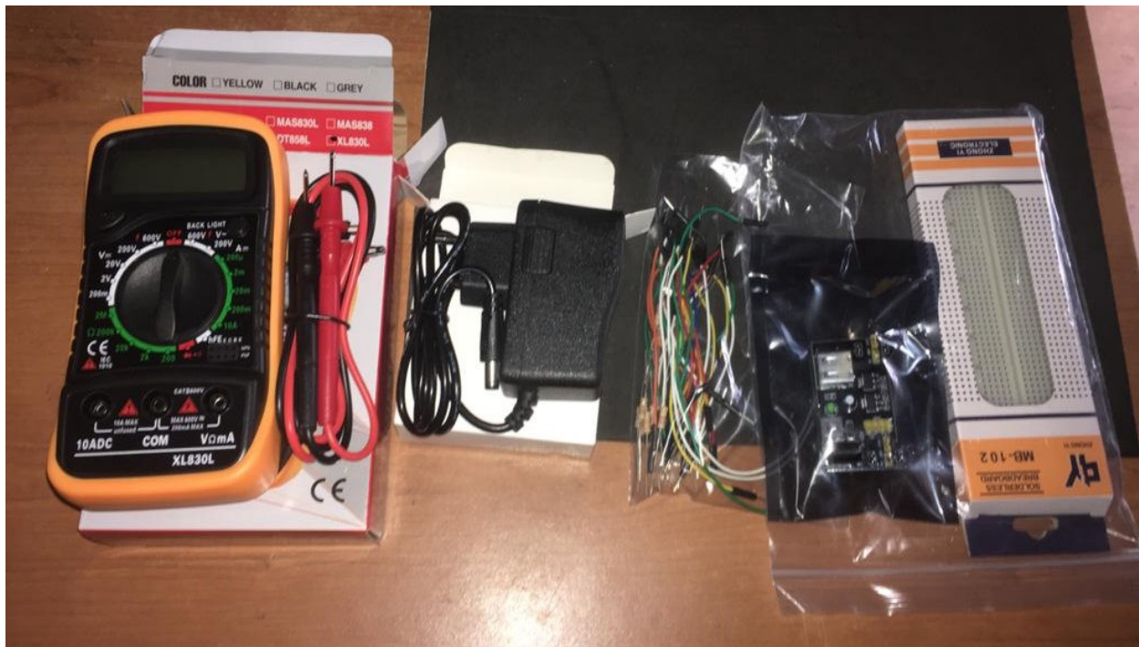
Figura 2. Kit de práctica para el Taller III Ingeniería Electrónica.

En la Fig 2, se muestran estos elementos enviados a los y las estudiantes que no residen en Valdivia, por los correos que ofrecen transporte en el mercado nacional, mientras que a los y las que residen en Valdivia se entregaron personalmente.