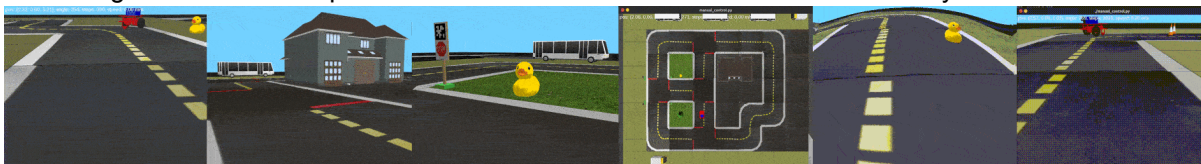
Figura 1: Diferentes puntos de vista de la ciudad simulada a través de Gym-Duckietown

Para la realización del curso en contexto online, se utilizó la plataforma Gym-Duckietown, el simulador de parte de Duckietown para el entorno virtual en el cual los estudiantes de manera remota pueden realizar y poner en práctica lo que se va integrando clase a clase, a través de desafíos semanales con fines de que puedan poner inmediatamente en práctica los contenidos. Las primeras clases se enfocan en poner en conocimiento que se utilizará Gym-Duckietown para la realización del curso 7 , para ello los requerimientos en necesarios son Python 3.6 o superior, OpenAI Gym, NumPy, Pyglet, PyYAML y Cloudpickle (Chevalier et al., 2018). Esta modalidad por su parte tuvo interesantes desafíos, como generar un mapa para el simulador , en el cuál debían agregar ciudadanos ( patitos ) en diferentes posiciones más un objeto a elección.