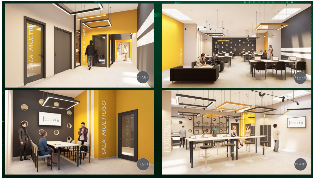
Figura N° 2. Centro de Innovación Living Labs

Todo estudiante dispuesto a participar en este Laboratorio debe realizar dos talleres previos: Taller de modelamiento y Taller de desarrollo de habilidades blandas . Se espera que estos talleres inicien sus servicios en agosto de 2024. Sin embargo, también se considerará la participación de estudiantes de último año, sin la necesidad de que pasen por estos talleres.